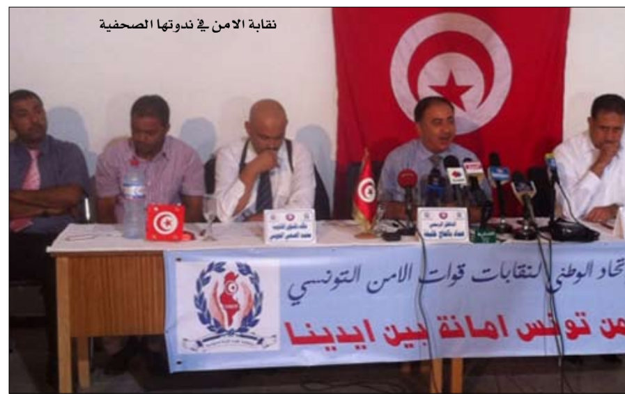
نقابة الامن في ندوتها الصحفية

وأضاف الباجي قايد السبسي أن تواصل الإرهاب وتدهور الحالة الاجتماعية وارتفاع نسبة البطالة وانهيار الجهات يتحمل مسؤوليتها من اقتراح مقترحات سدت الأقف، في إشارة إلى أحزاب الترويكا.