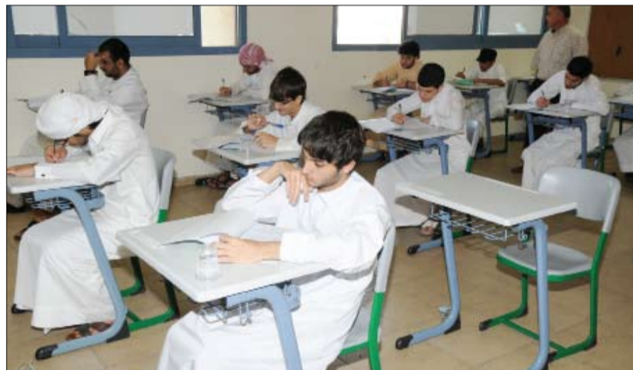
عدد من الطلبة خلال دراستهم في إحدى الفصول الدراسية

أيضاً وجود فائض عن الحاجة في بعض المواد، إضافة إلى نقص بالطبع في مواد أخرى. وأضافت أن اليوم الأول للعام الجديد يعد يوماً دراسياً غير عادي من خلال اليوم المفتوح أو مبادرة مرحباً مدرستي التي تهدف إلى إيجاد بيئة تعليمية جذابة ومشوقة للطلبة من بداية اليوم الأول لانضمامهم في الصفوف، فضلاً عن تعزيز روح الانتماء للمدرسة لديهم، وتوثيق علاقة البيت بالمدرسة، وتعريف أولياء الأمور بالنظام العام للمدرسة، وتفعيل دورهم في التعاون مع الإداريين والمعلمين من أجل تحقيق مصلحة الأبناء.