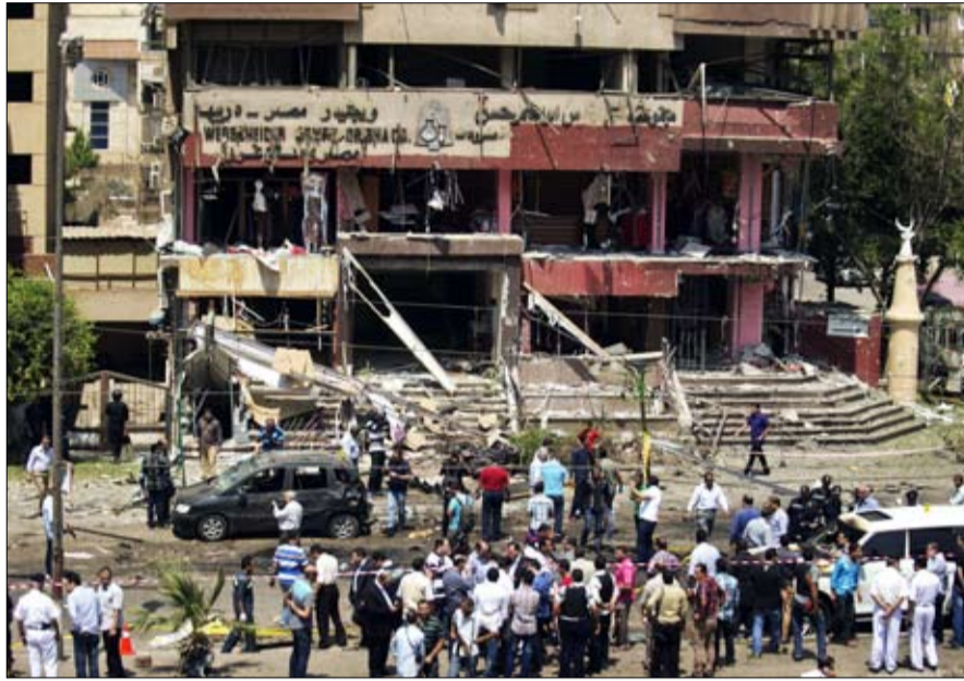
مستشارو أوباما يوصونه بتعليق المساعدات لمصر