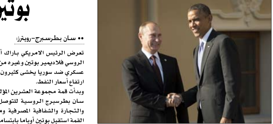
•• سان بطرسبرج-رويترز:

إن قرار استئصال هذا الورم الخبيث، تعليمه المصلحة الوطنية المصرية، ويجب ألا تعطل أو تؤجل حملات الكذب والتزييف المتوقعة، ساعة اتخاذها، فستبقى حقيقة جماعة الإخوان المرعبة ترددي ملايسها، ويستحيل على الآلة الدعائية للتنظيم الدولي لإخوان دفتها تحت الحما..!