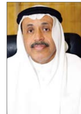
علي ميحد السويدي

التربية والتعليم بالإجابة. وأشاد وكيل وزارة التربية والتعليم بالإجابة، أن الوزارة أنهت عملية سد احتياجات المدارس من المعلمين، حيث أن الشواغر الإجمالية كانت قد وصلت نهاية العام الماضي إلى 652 معلماً ومعلمة، وهي تشمل: الحاجة الفعلية للمدارس 324 معلماً ومعلمة، والاستقالات والترقيات، وتم بالفعل تسكين المعلمين كل حسب الشاغر والتخصص. وأضاف أنه تم الانتهاء من توزيع الكتب الدراسية المقررة على جميع المدارس، فضلاً عن سد احتياجات المدارس من أجهزة التكييف، حيث زودت الوزارة المدارس بـ 3200 جهاز تكييف من نوع اسبلت، إلى جانب أعمال الصيانة التي خضعت لها أجهزة التكييف الأخرى، وفق ما حددهت المدارس