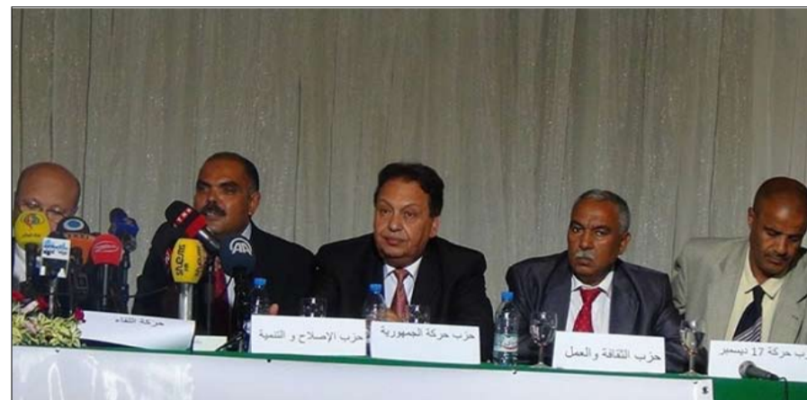
•• الفجر - تونس - خاص

حذر الاتحاد الوطني لنقابات قوات الأمن التونسي خلال مؤتمر صحفي أمس الجمعة السلطات التونسية مما اعتبره تعاطف غير مسؤول مع ملف الإرهاب. وقال المكلف بالشؤون القانونية في الاتحاد إنه سيتم قريباً إعلان تونس أرض جهاد من قبل تنظيمات إرهابية تونسية ودولية. وأكد الاتحاد الوطني لنقابات قوات الامن التونسي خلال مؤتمر صحافي عقده أمس الجمعة أن الإرهاب سيعود لضرب تونس خلال الثلاث أشهر القادمة بأساليب جديدة إذ لا يتم التعامل معه من قبل السلطات الأمنية والقضائية بجديّة. وكشف الاتحاد أن عددا من القضاة متورطين في الإفراج عن بعض العناصر الإرهابية وأنه تم رصد بعض القضاة داخل سيارات خاصة برفقة عناصر جهادية. وقدم قيادات الاتحاد الوطني لنقابات الأمن التونسي