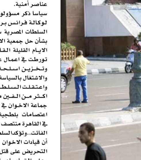
مواطنون مصريون وقوات الامن في مواجهة البلطجة التي مارسها الإخوان أمس في شوارع الاسكندرية

أصيب عدد من الأشخاص، بعد ظهر امس الجمعة، في اشتباكات بين أنصار الرئيس المصري المعزول محمد مرسي ومعارضيه بمدينة طنطا المصرية، بينما تظاهر عشرات من أنصاره بالقاهرة رفضا لما يسمونه الانقلاب على الشرعية. وهاجم مئات من المواطنين بمدينة طنطا (مركز محافظة الغربية شمال غرب القاهرة)، بعد صلاة الجمعة، مسيرة مكونة من عشرات يناصرون الرئيس المعزول محمد مرسي، فوقعت اشتباكات بالأيدي وبالهاويات وتراقف بالحجارة بين الجانبين أسفرت عن إصابة عدد غير محدد تم نقلهم بسيارات الإسعاف إلى المستشفى الجامعي. وأبلغ مصدر محلي بالمدينة يوناتيد برس انترناشونال، بأن الاشتباكات أدت كذلك إلى تحطيم واجهات محال تجارية في شارع سعيد وحسن رضوان التجاريين، فيما غابت عناصر