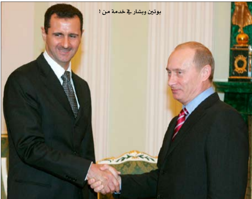
بوتين وبشار في خدمة من !

أما إذا ما ساءت الأمور، فإنه بإمكان الروس أيضا، الإفلات والتصلّب ضدّ المسؤولية، وسيقولون: لقد حذّرناكم ولكنكم لم تستمعوا إلينا... تبقى الإشارة، إلى انه ليس مهما من الذي سيكسب، موسكو أم واشنطن، وما هو حجم الربح الذي سيحققه أي منهما، فالنائب الوحيد اليوم، هو أن الشعب السوري سيكون الخاسر الأوحد، والضحية الأولى والأخيرة، في هذا الفصل الجديد من لعبة الأمم..