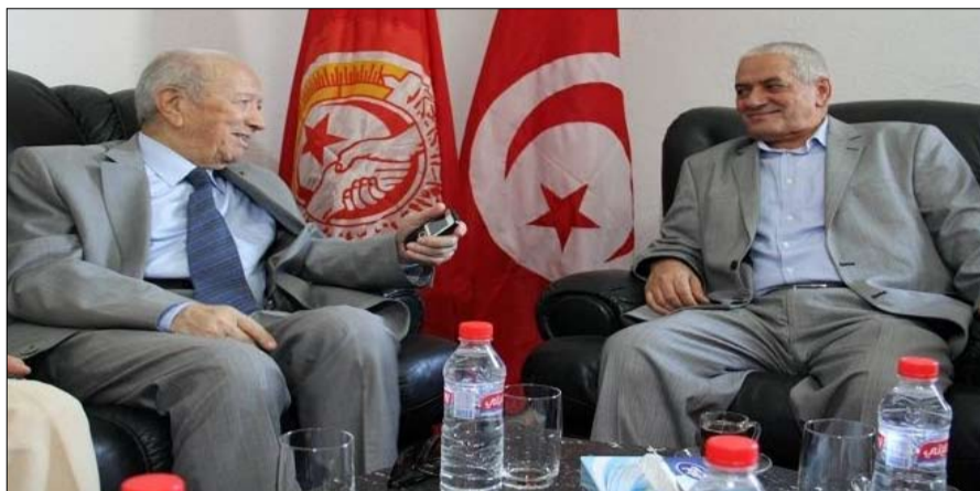
المعارضة مشيراً إلى أن النية تتجه إلى الاعتماد في القصة وشراح الحبيب بورقيبة.

وقال القيادي في حزب التحالف الديمقراطي، أن حركة " النهضة " تريد إيهام الرأي العام أنها متمسكة بمبادرة الاتحاد لكنها في الحقيقة رافضة لها " وتسمى إلى المحافظة على الحكومة الحالية وكأن شيئاً لم يحصل. كما شدّد البارودي على ضرورة مواصلة الضغط والحراك الاحتجاجي من أجل تحقيق مطلب إسقاط الحكومة وتغييرها بحكومة كفءات قادرة على إتمام المرحلة الانتقالية. وكانت الجبهة الوطنية للإنقاذ قد حملت مسؤولية فشل مبادرة الاتحاد العام التونسي للشغل لأحزاب الترويكا. وقررت الجبهة بقاء الهيئة السياسية في اجتماع مفتوح والتعبئة الشعبية إلى حين فرض قبول المبادرة. النهضة تنهم في المقابل، صرح القيادي بحركة النهضة وزير الصحة عبد اللطيف المكي، أن الحوار الوطني معطل لأن الجبهة الشعبية تريد تأجيل الانتخابات لمدة سنة، وهو هدف خفي للجبهة حسب قوله.