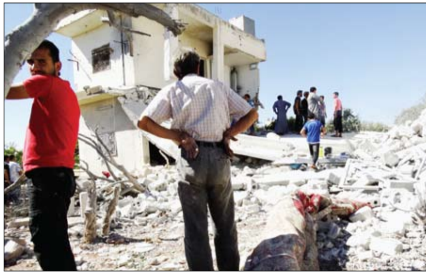
بيوت المدنيين في إدلب بعدما حولها قصف النظام إلى ركام

بين القوات النظامية ومقاتلي الكتائب المقاتلة بمحيط الفرقة 17 ليل الخميس الجمعة وسط استهداف الكتائب المقاتلة للفرقة تراقف مع قصف القوات النظامية مناطق في مدينة الرقة. الطيبة بمحافظة الرقة. وقال المرصد إن مناطق في حي جوبر بالعاصمة دمشق تعرضت بعد منتصف الليلة الماضية لقصف من قبل القوات النظامية بقذائف الهاون. وأضاف أن مناطق في بلدي الدبابية وعين ترما بمحافظة ريف دمشق تعرضت لقصف من قبل القوات النظامية، مما أدى لسقوط جرحى كما دارت بعد منتصف ليل أمس اشتباكات عنيفة بين القوات النظامية ومقاتلي الكتائب المقاتلة على محور بلدة عقربا تراقف مع قصف القوات النظامية مناطق في بلدة بيت سحم. وقال ناشطون إن قوات النظام استهدفت بالصواريخ إحدى الكنائس في مدينة عرين بريف دمشق، وأفاد مركز صدى بأن